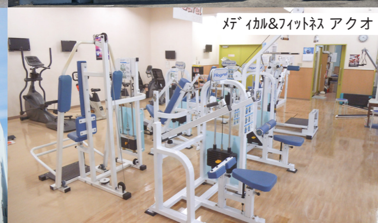
メディカル&フィットネス アクオ