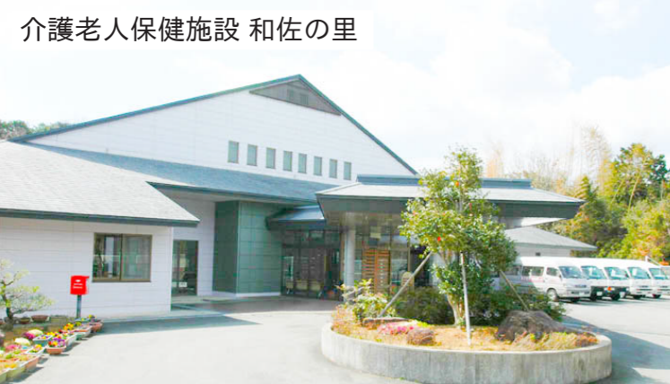
介護老人保健施設 和佐の里