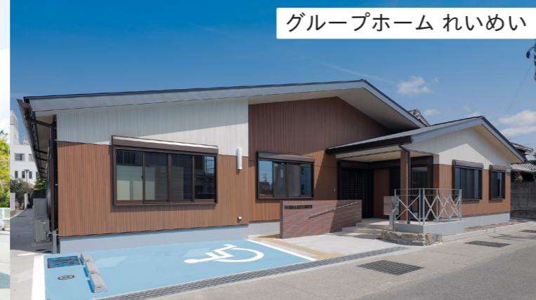
グループホーム れいめい