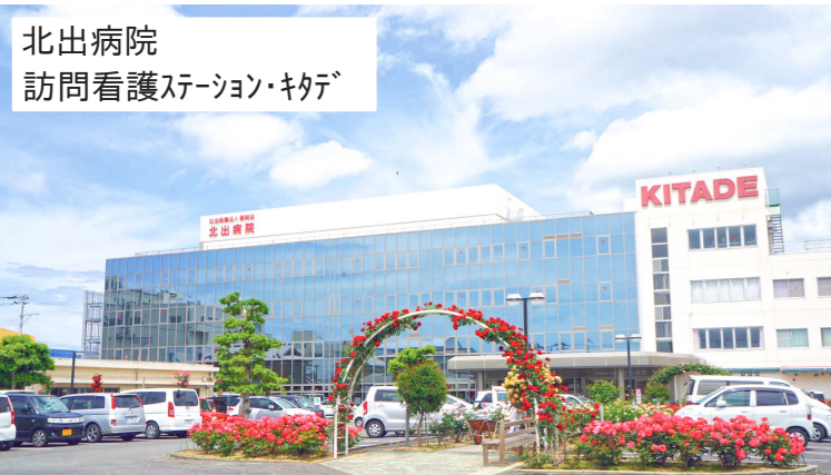
北出病院 訪問看護ステーション・キタデ