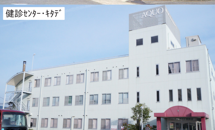
健診センター・キタデ