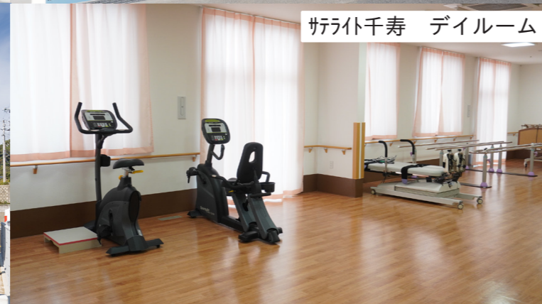
サテライト千寿 デイルーム