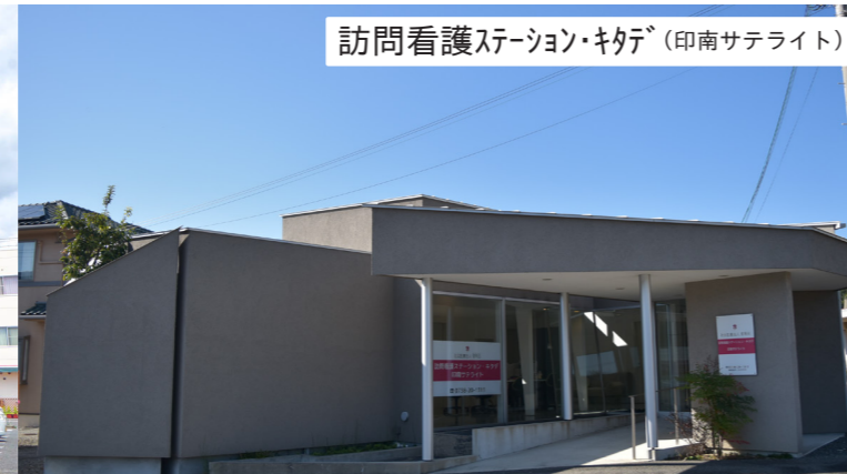
訪問看護ステーション・キタデ (印南サテライト)