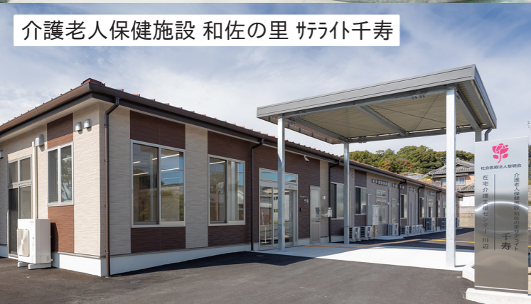
介護老人保健施設 和佐の里 サテライト千寿