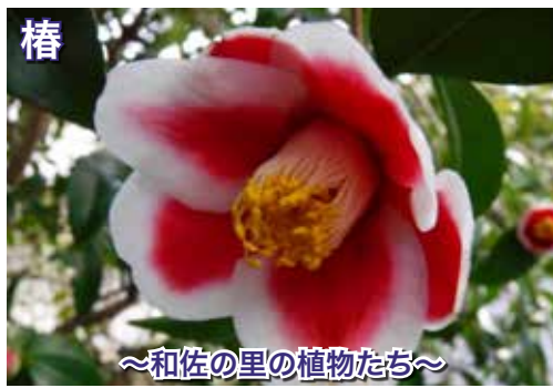
～和佐の里の植物たち～

メジロやウグイスの美しい歌声を聞くと心が和みます。コロナウイルスの影響でイベントが中止されていますが、観梅の多いですが、観梅ドライブなどで楽しむのも良いですね。